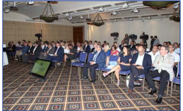
Στιγμιότυπα από τη Γενική Συνέλευση