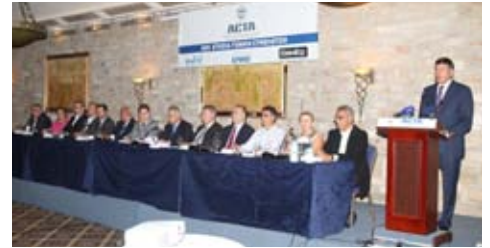
Ο Πρόεδρος του ΚΕΒΕ προσφωνεί τη Γενική Συνέλευση